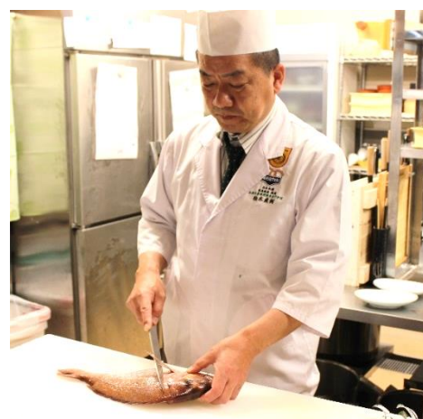
日本料理 柏木マイスター