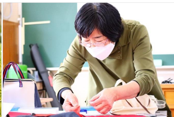
婦人子供服 秋國マイスター